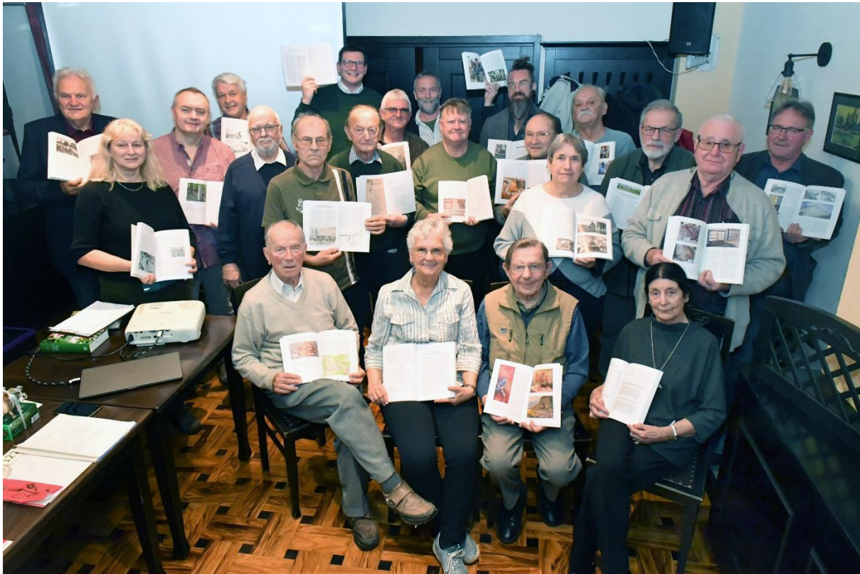
Bei der Präsentation des Heimatkalenders Jahrgang 71 für 2026 am 7. November 2025. Die Autoren präsentieren ihre Beiträge im Kalender.