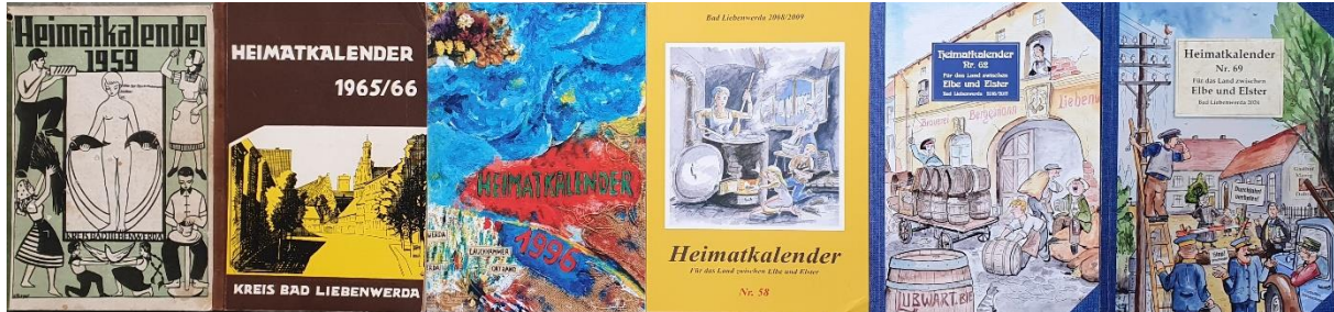
Einbände verschiedener Jahrgänge der Heimatkalender aus der Zeit nach dem Zweiten Weltkrieg