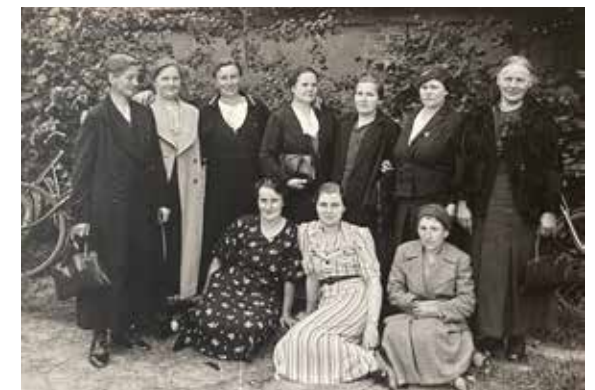
Abb. 5: Faszination Chronikfotos: Die Aufnahme mit dem Hinweis »Frauen aus Trebnitz beim Ausflug an der Gaststätte Kurzer Arm« ist undatiert. Wer hier wann abgelichtet wurde, lässt sich nur noch durch Recherchen ermitteln.