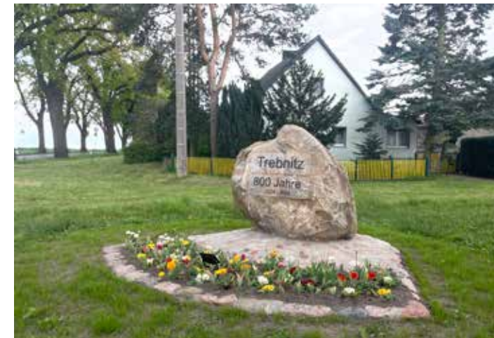
Abb. 3: Stein des Anstoßes: Vor 800 Jahren schenkte Herzog Heinrich der Bärtige 200 Hufen im Lebusener Land dem schlesischen Kloster Trebnitz, das dort ein gleichnamiges Dorf gründete: Trebnitz in der Mark. Das Jubiläum ist Anlass für eine intensive Annäherung an die Dorfgeschichte.