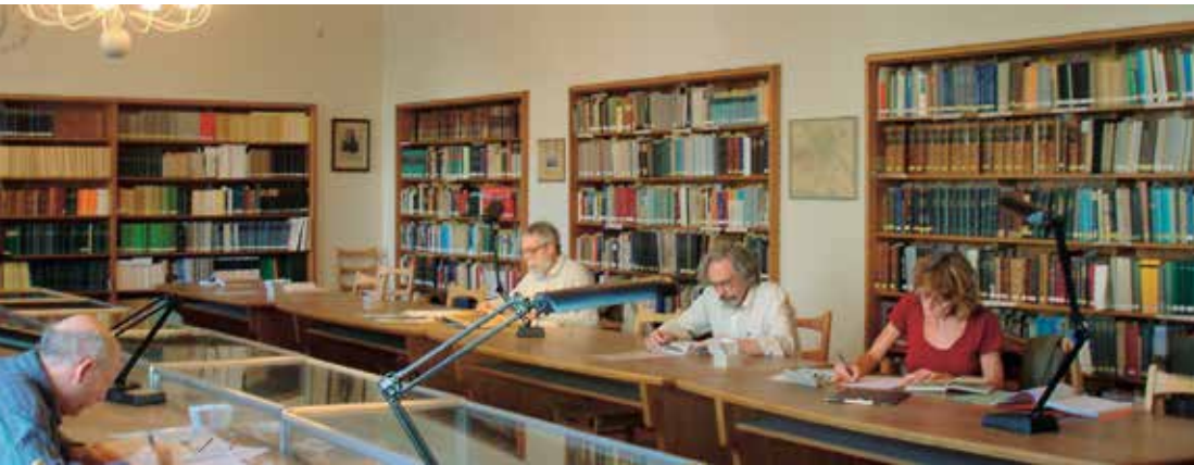
Abb. 8: Guter Ausgangspunkt für märkische Forschungen: der Lesesaal der Landesgeschichtlichen Vereinigung für die Mark Brandenburg am Berliner Stadtschloss.

zugestellten Räumlichkeiten des Vereins im Neuen Marstall gegenüber dem Berliner Stadtschloss finden sich alle für den Einstieg in die Recherche nötigen Brandenburgica: Ortslexika, historische Kartenwerke, Namensbücher, Adelsstammbäume, Bildbände, Kreiskalender, Zeitschriften, Ansichtskarten, Sammelbände und rund 80.000 Monografien. Der Besuch in der Landesgeschichtlichen Vereinigung, die 1884 in Berlin ganz im Sinne Fontanes als »Touristen-Club für die Mark Brandenburg« ihre Tätigkeit begann, ist auch wegen der fachlichen Beratung und propädeutischen Einführung in die Bestände durch den Vorsitzenden Dr. Peter Bahl ein echtes Erlebnis.