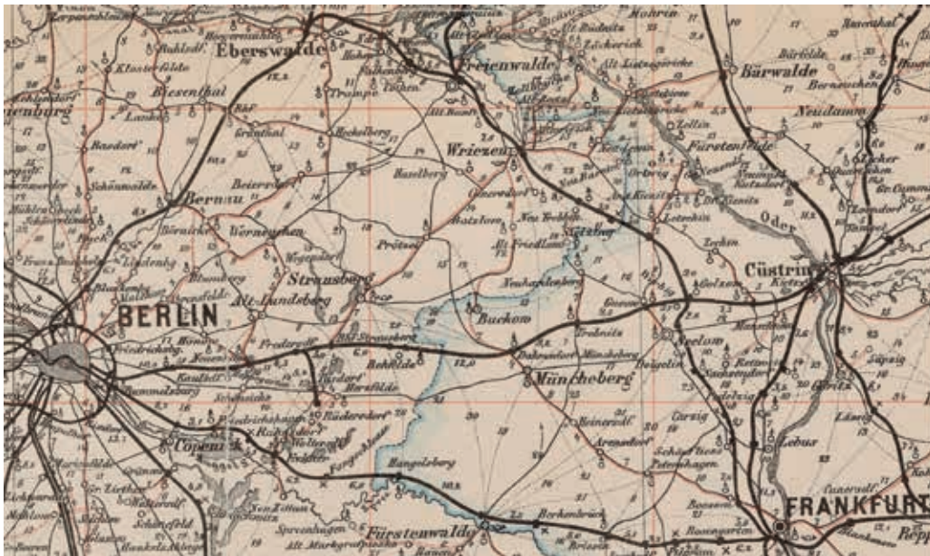
Abb. 2: Trebnitz an der Ostbahn, 55 km östlich von Berlin, war schon im 19. Jahrhundert ein beliebter Ausgangspunkt für Wanderungen durch die Märkische Schweiz und das Lebusener Land. Ausschnitt aus Lehmann's Verkehrs-Karte der Provinz Brandenburg, 1887.

Erst an dieser Stelle beginnt die intensive Beschäftigung mit der Dorfgeschichte und wird es richtig spannend. Mehr und mehr Themen und mögliche Leerstellen aus Jahrhunderten der Dorfgeschichte ziehen Fragen nach sich und locken so in die weiterführende Recherche – online und auf dem Papier. Nun gilt es die Materialsammlungen der Dorfchronik zu durchforsten, Literatur zur Landes- und Regionalgeschichte zusammenzustellen, Gespräche mit Fachleuten zu führen und letztlich den Gang in die Archive anzutreten. Doch begann auch bei der vorliegenden historischen Neuvermessung von Trebnitz alles mit der Fontaneschen Wanderung und dem Blick des Besuchers. Wie es sich für ein märkisches Dorf gehört.