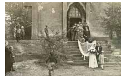
Abb. 4: Einblicke in Trebnitzer Fotoalben, Brautpaar vor der Dorfkirche, 1957.