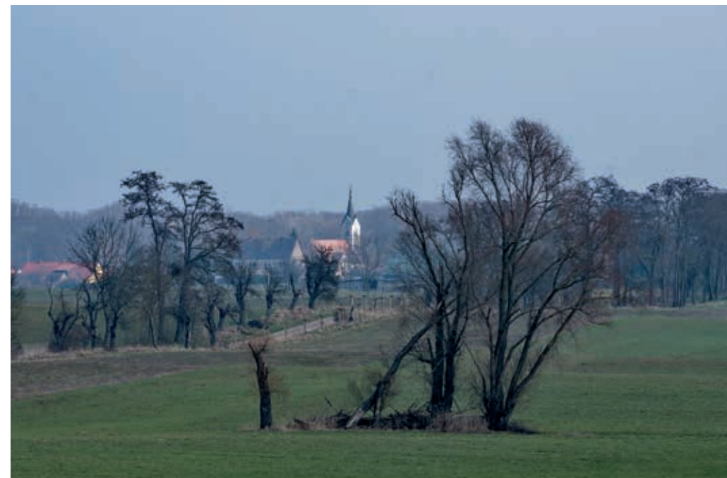
Abb. 10: Blick auf Trebnitz von Südwesten.

Angesichts dieser Aktenlage besteht die Gefahr, märkische Dorfgeschichte bis ins 20. Jahrhundert hinein vorrangig und gleichsam verzerrt aus der Perspektive staatlicher Behörden, kirchlicher Verwaltung und der Gutsherrschaft zu schreiben. Denn sogenannte Ego-Dokumente wie Tagebücher, private Korrespondenzen oder Autobiographien, die Einblicke in das Alltagsleben der Trebnitzer Dorfbewölkerung geben könnten, liegen für die Zeit vor 1945 nahezu nicht vor. Hilfreich sind hier zumindest die Trebnitzer